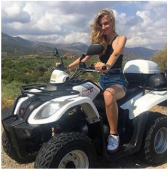
— Wer braucht schon ein Auto? Eine Entdeckungstour auf dem Quad ist viel lustiger