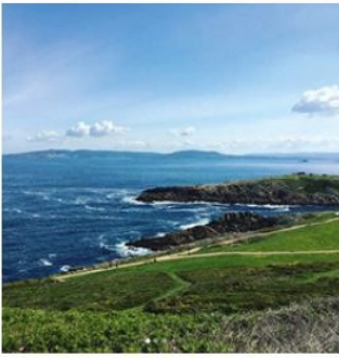
— Vom Reisen kann ich nie genug bekommen, unsere Welt ist so vielseitig und schön