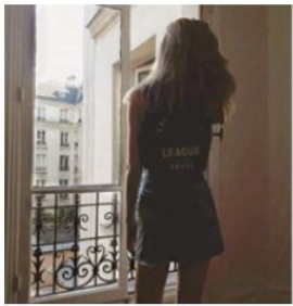
— Bonjour, Paris!