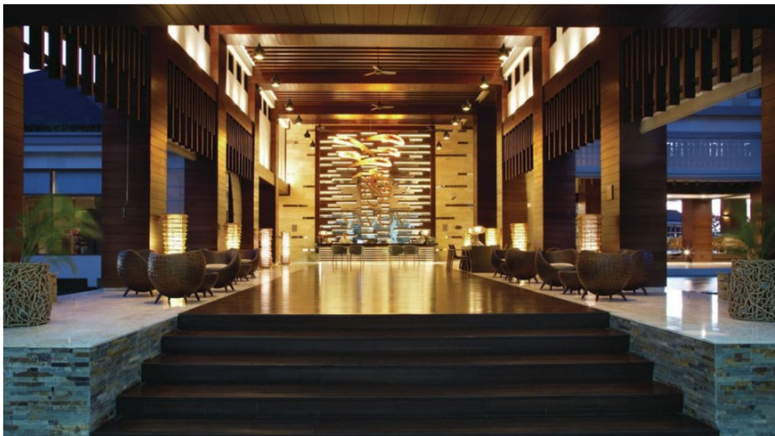
An Silvester lädt das Savoy Resort & Spa zur Entspannung inmitten der beeindruckenden Natur der Seychellen.